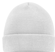
Beanie / Knitted-Beanie